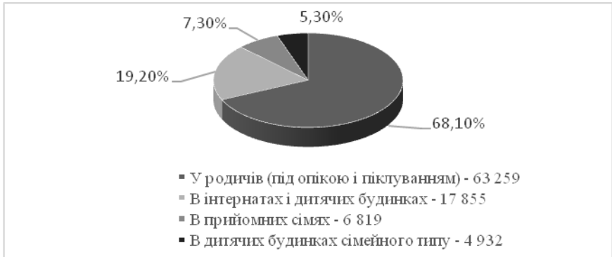
Рис. 2. Місця виховання українських дітей-сиріт [2]

Ці протиріччя говорять про те, що питання соціальної адаптації вихованців інтернатних установ потребує детального вивчення, стосовно формування соціального досвіду у дітей, позбавлених батьківського піклування та виховуються в системі інтернатних закладів, необхідного для успішної адаптації і самореалізації в соціумі.