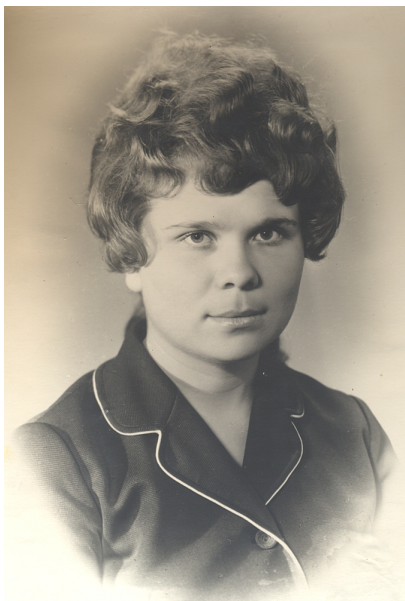
Випускниця Донецького державного університету (1975)