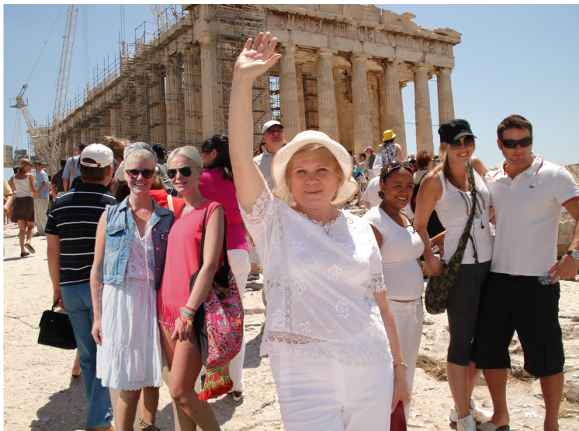
Спілкування з вічністю. Біля храму Афіни Палади в центрі грецької столиці (2009)