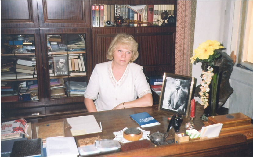
У робочому кабінеті Олеся Гончара (2005)