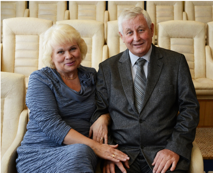
Нам разом – 125 років! (2013)