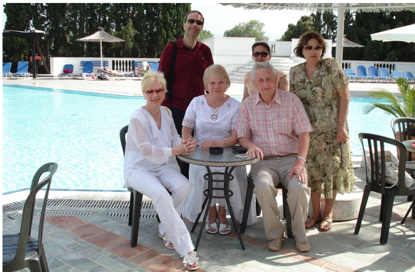
Члени науково-методичної комісії з журналістики МОН України у Греції (о. Евбея) на зустрічі з грецьким письменником Нікосом Лігеросом (2009)