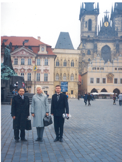
Прага (Чехія). З літературознавцями із Братислави (1988)