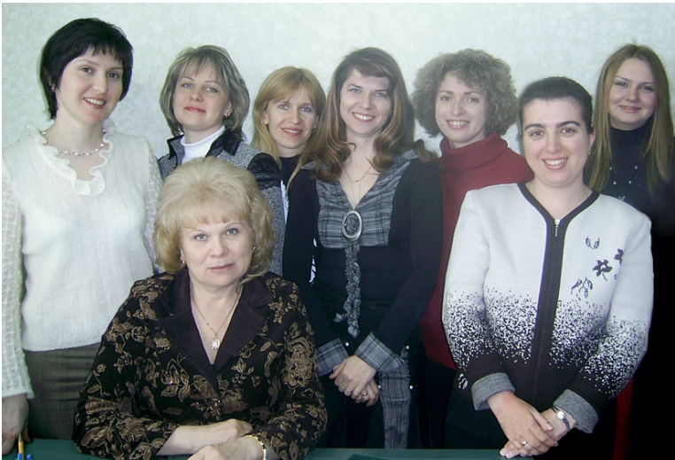
Кафедра журналістики і видавничої справи (24.06.2007)