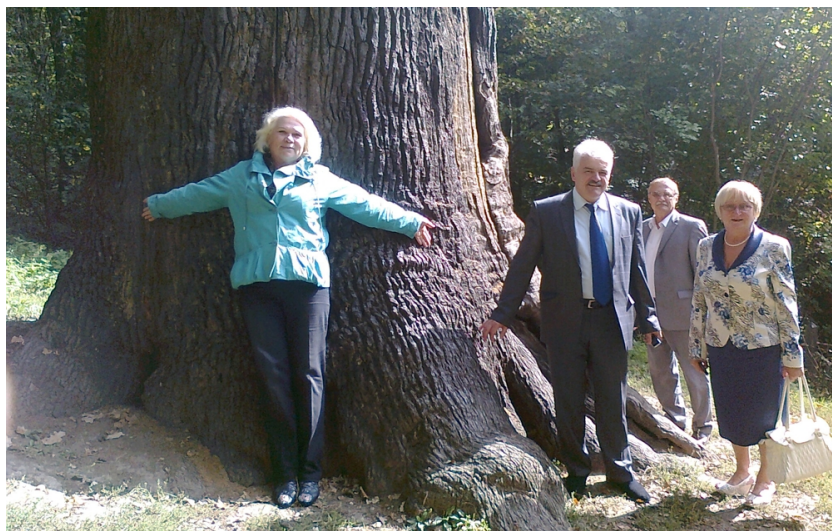
Біля козацького дуба в Чигирині з членами комісії МОН України з акредитації Черкаського національного університету ім. Богдана Хмельницького