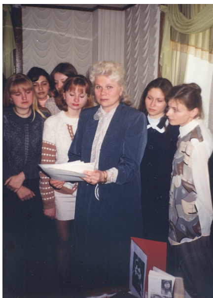
Після відкритого заняття «Мій Олесь Гончар», проведеного в Рівненській обласній науковій бібліотеці (1998)