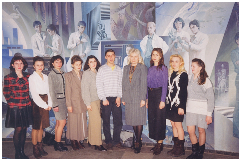
Із студентами-практикантами Рівненського педагогічного інституту (1996)