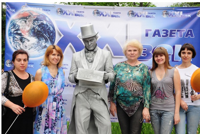
З колегами на медіавернісажі в Луганську (2011)