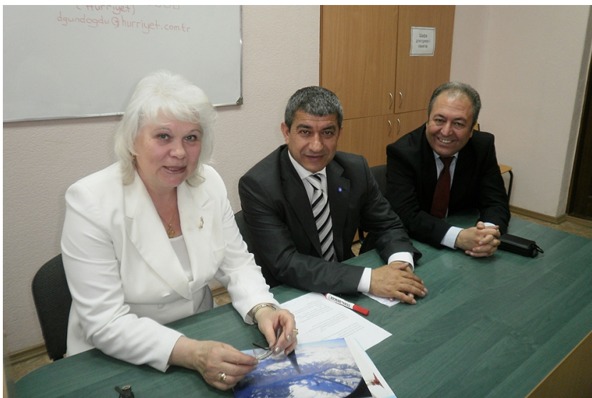
З керівниками ЗМІ Туреччини (2009)