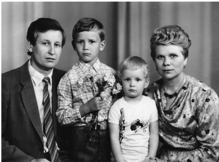
Родина Галичів (1978)