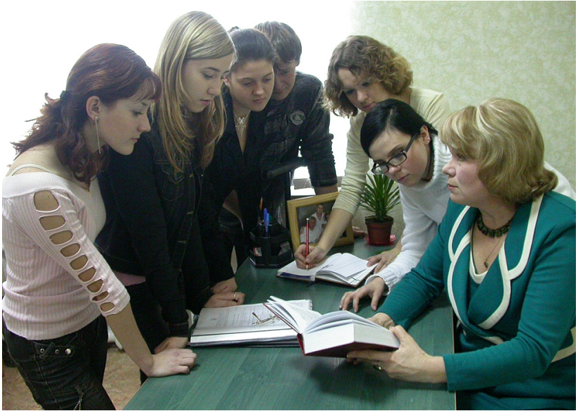
Із студентами спеціальності «журналістика» першого набору (2005)