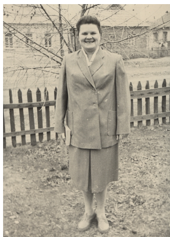
Мама – вчителька (1960)