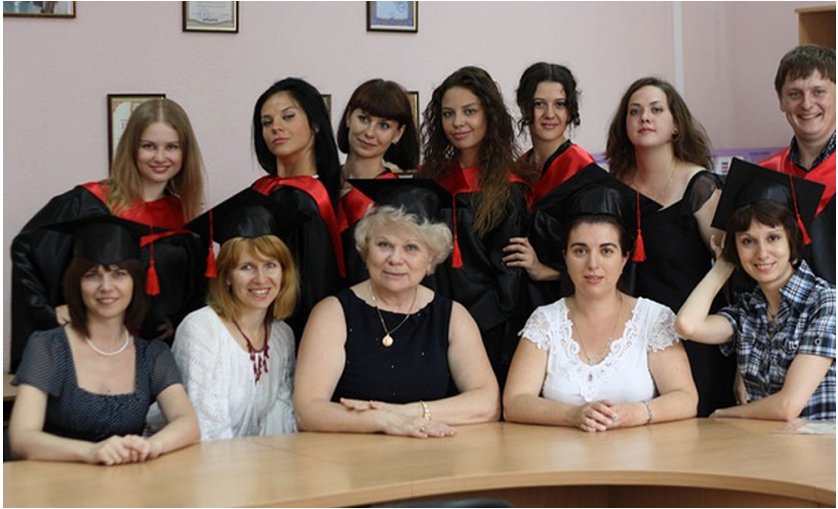
Перший випуск магістратури із спеціальності «Журналістика» (2011)