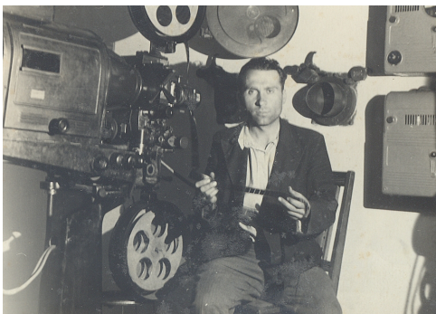
Тато – кіномеханік (1958)