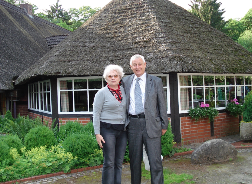
У пошуках українства в Німеччині (2011)