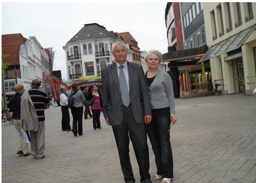
Ольденбург, Німеччина (2011)