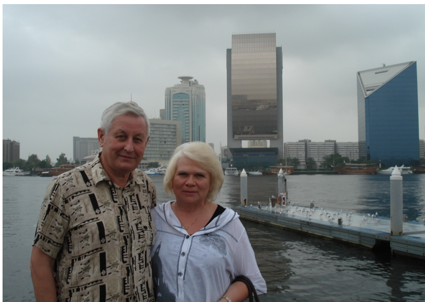
Дубаї, Об'єднані Арабські Емірати, 2013 р.