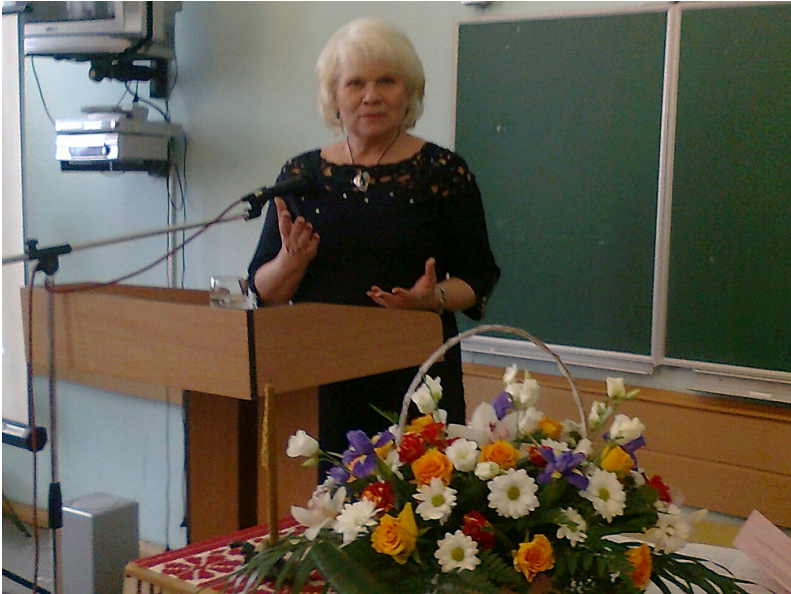
Виступ на конференції, приуроченій 95-річчю від дня народження Олеся Гончара (2013)