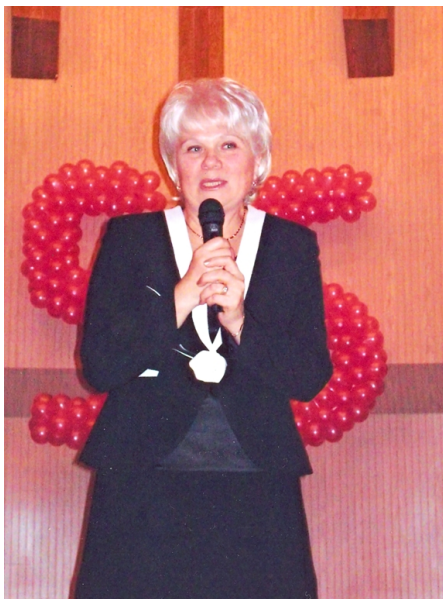
Сердечно дякую за поздоровлення! У день 55-ліття (2008)