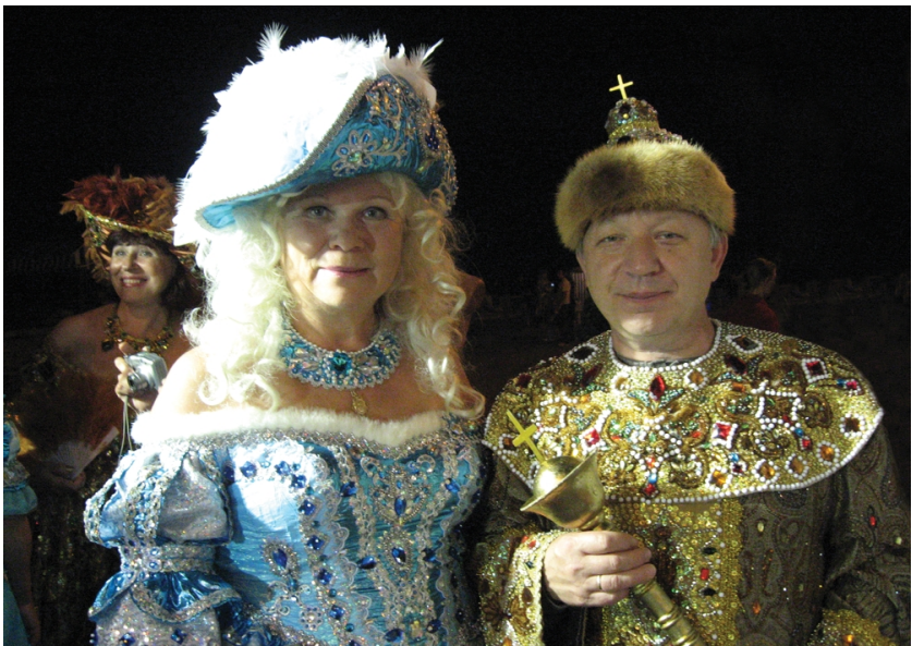
Учитель і учениця: чудесні перевтілення