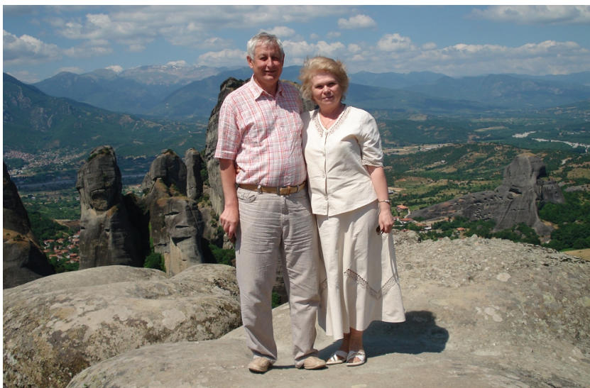
У горах Греції (2009)