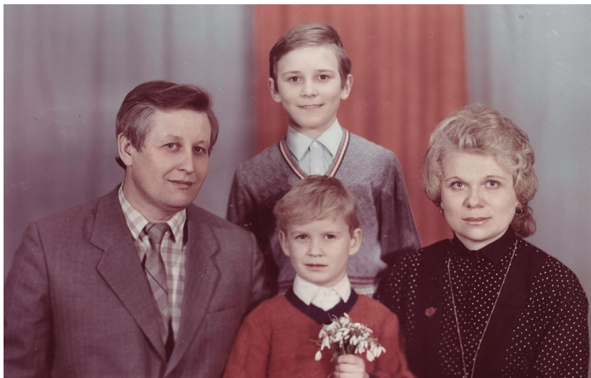
Дружня сім'я (1991)