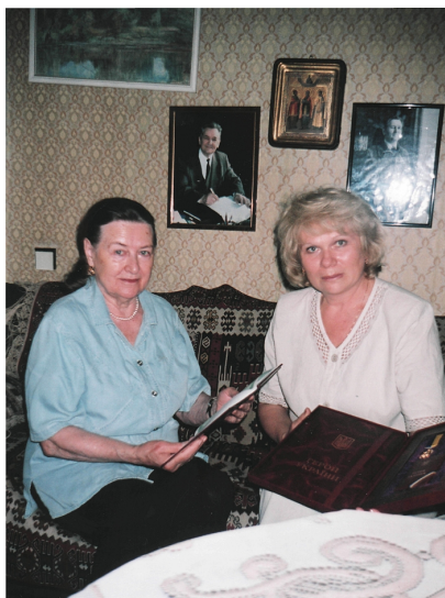
З дружиною письменника Олеся Гончара – Валентиною Данилівною. Дві відзнаки: Героя України Олеся Гончара і диплом доктора наук В. Галич (2005)