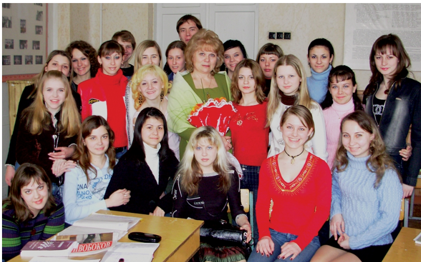
Із студентами (2008)