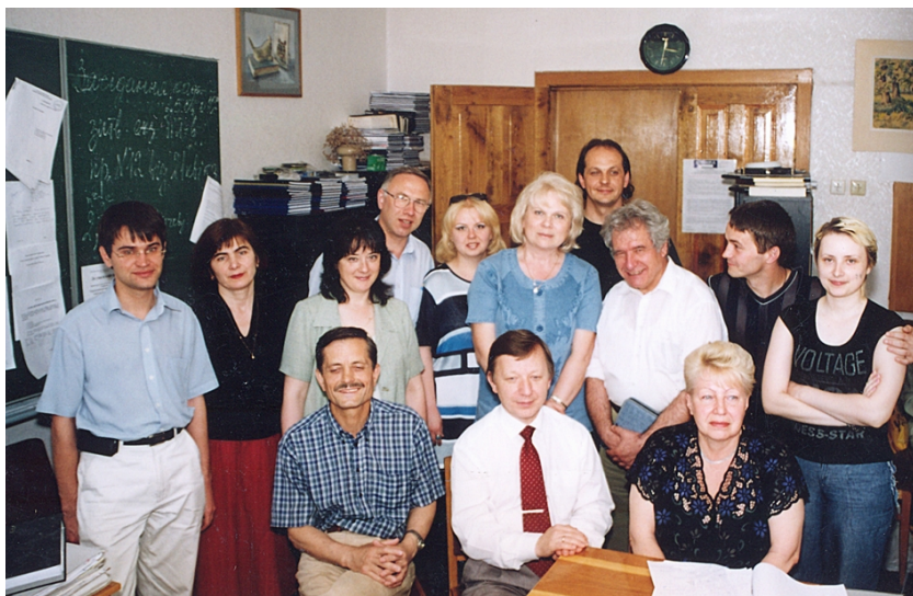
Після засідання кафедри журналістики і видавничої справи Інституту журналістики КНУ ім.Тараса Шевченка (2003)