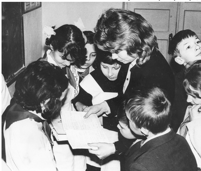
Під час педагогічної практики в СШ № 20 м. Донецька (1974)