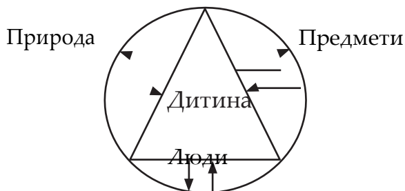
Рис. 2. Схема впливу оточення у моральному вихованні

Узагальнено це можна подати у вигляді схеми (див рис. 2).