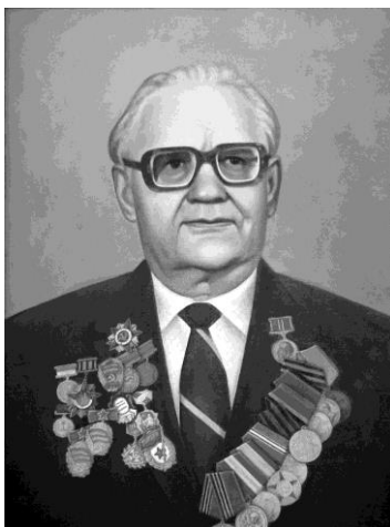
пам'яті академіка Степана Якимовича Дем'янчука

Присвячено пам'яті борців за мир, свободу і незалежність України,