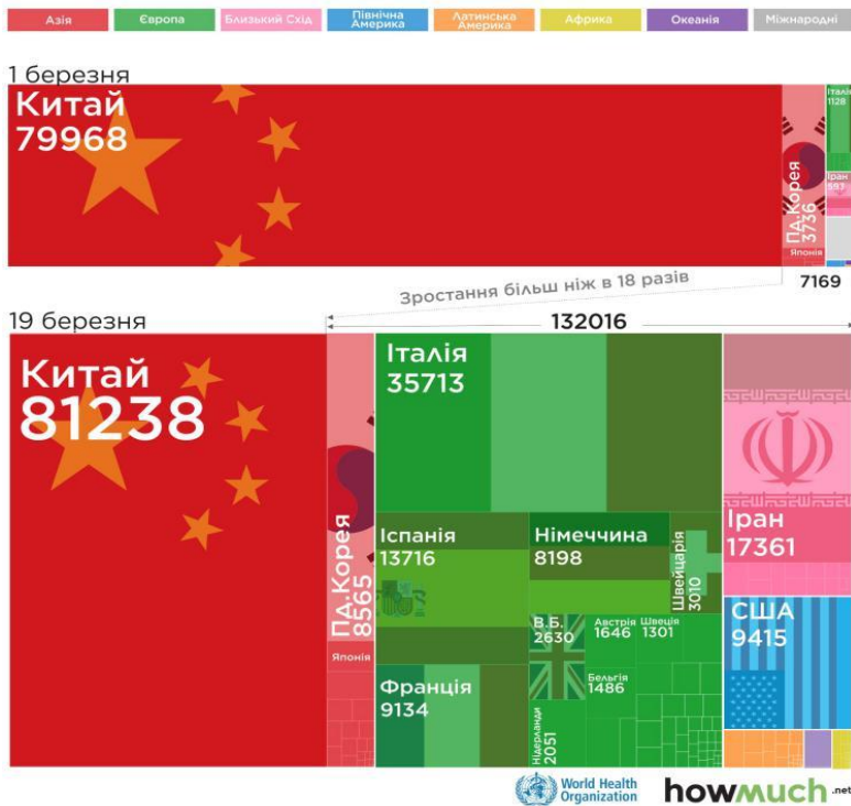
Рис. 2. Кількість зафіксованих підтверджених випадків COVID-19 за регіонами світу

В Італії ситуація значно складніша, оскільки 19 березня було зафіксовано 473 смерті за добу і не відомо коли даний показник досягне піку (рис. 3). В Україні станом на 19 березня зафіксовано 2 смерті від коронавірусу.