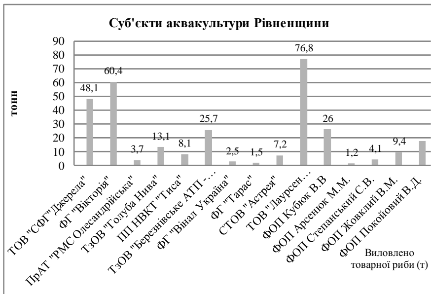
Рис. 2. Суб'єкти аквакультури Рівненщини станом на 2018 рік. Складено за даними джерела [5]

та рослиноідні риби далекосхідного фауністичного комплексу, які досягають товарної маси в умовах Полісся лише восени. Загальний вилов риби склав 179,32 т.