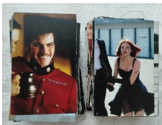
Мал.2. Набір МАК "Фільмотерапія"