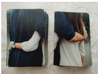
Мал. 1. Обкладинка МАК "Фільмотерапія"