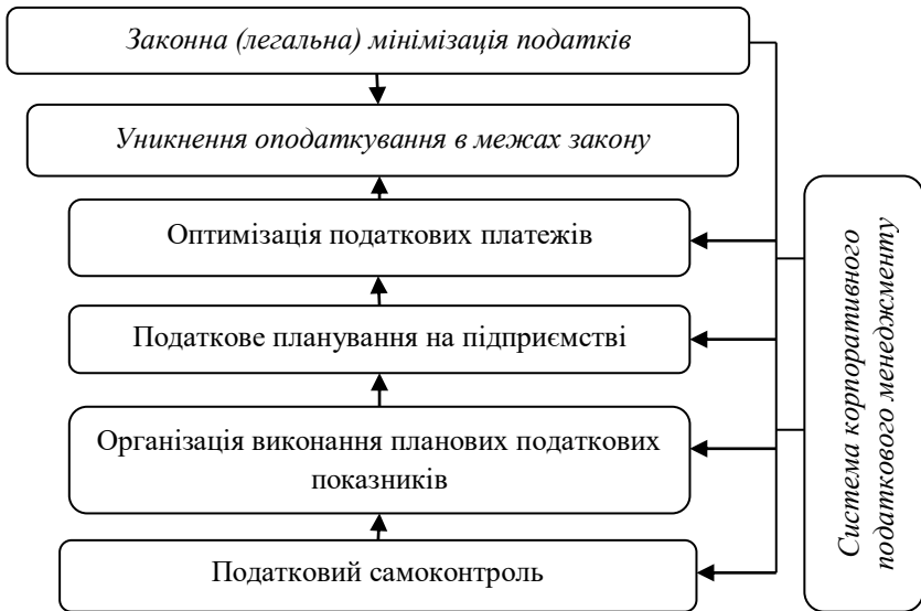
Рис. 3. Схема мінімізації податків у структурі корпоративного податкового менеджменту

Що стосується способів оптимізації податкових платежів, то вони є досить різноманітні. Найбільш поширені серед них: