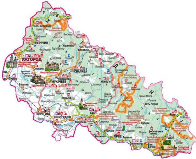
Рис. 2. Карта проживання русинів на території Закарпаття [4]

Землі сучасної Білорусії і велика частина земель сучасної України увійшли до складу нового центру збирання Землі Руської – Великого Князівства Литовського. Червона Русь увійшла до складу Польського королівства. Північний схід Русі (Володимиро-Суздальська Русь) опинилася під владою Золотої Орди, і тільки на півночі Пан Великий Новгород – «республіка» народного віча зберегла незалежність (цю землю скандинави називали «країною міст» – Гардарикою).