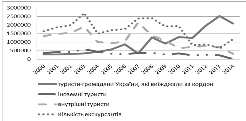
Рис. 3. Динаміка туристичних потоків у 2000–2014 роках за видом туризму, осіб (побудовано за даними [2])

Динаміка туристичних потоків в Україні наведена на рис. 3.