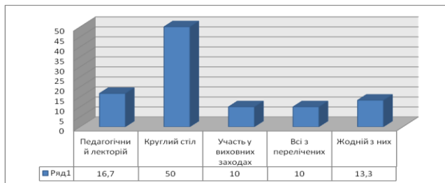
Рис. 2. Якій з форм співпраці з педагогічним колективом Ви б надали перевагу?

На запитання «Якій з форм організації співпраці з педагогічним колективом Ви б надали перевагу?» розділилися таким чином (рис. 2).