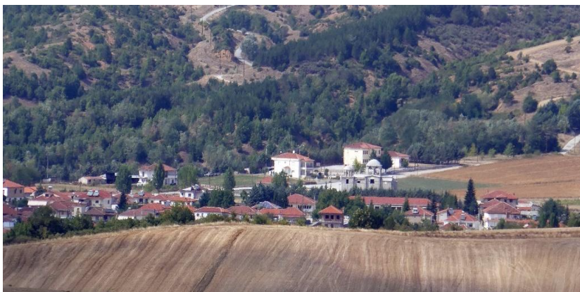
Рис. 2. Район Kastoria