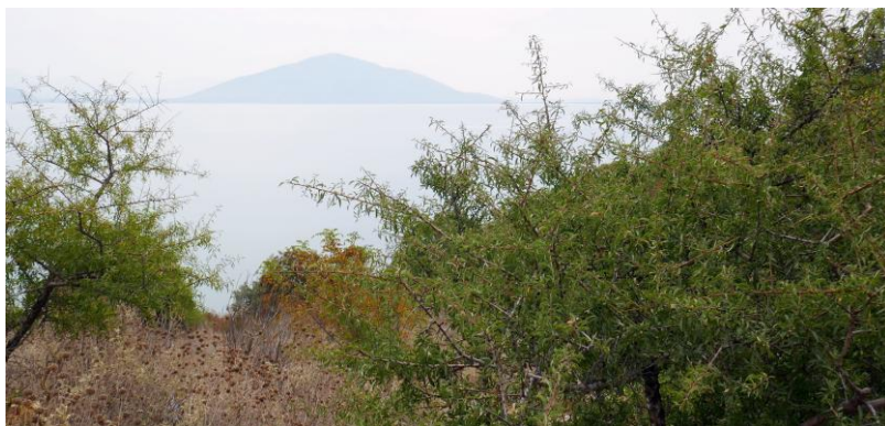
Рис. 1. Район Igoumenitsa

мозаїки, яка включає водно-болотні угіддя, сухі й напівсухі луки, тут розташовані густі ліси, які органічно поєднуються із садами, полями та іншими частинами сільського пейзажу (рис. 2). В знак визнання важливості цього району, багато вчених, студенти, відвідувачі й дослідники створили та використовують біологічні станції, а також беруть участь в конференціях і волонтерських заходах. Різні державні й грантові програми фінансують реконструкцію місцевих традиційних будівель, які служать місцем проживання й зустрічі, вони переважно знаходяться під керівництвом жіночих кооперативів. Базова інфраструктура таких місць спонукала приватні компанії постачати продукти харчування, житло та інші послуги, а також залучати державні інвестиції, орієнтовані на екологічний туризм [2, с. 265].