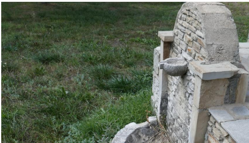
Рис. 3. Старовинна поїлка для кіз. Район Alakmonas

Усі види діяльності, доступні в такому екологічно туристичному районі, або сприяють поліпшенню місцевого навколишнього середовища, або не мають негативного впливу на нього. Місцеві археологічні пам'ятки (рис. 3), мають величезний туристичний потенціал для відвідувачів Греції.