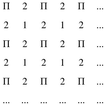
1. Рис. 1. Схема прогресуючого ієрархічного опрацювання пікселів зображення на шарах, починаючи з другого: П – пікселі попереднього шару; 1- пікселі першого проходу чергового шару; 2 - пікселі другого проходу чергового шару.