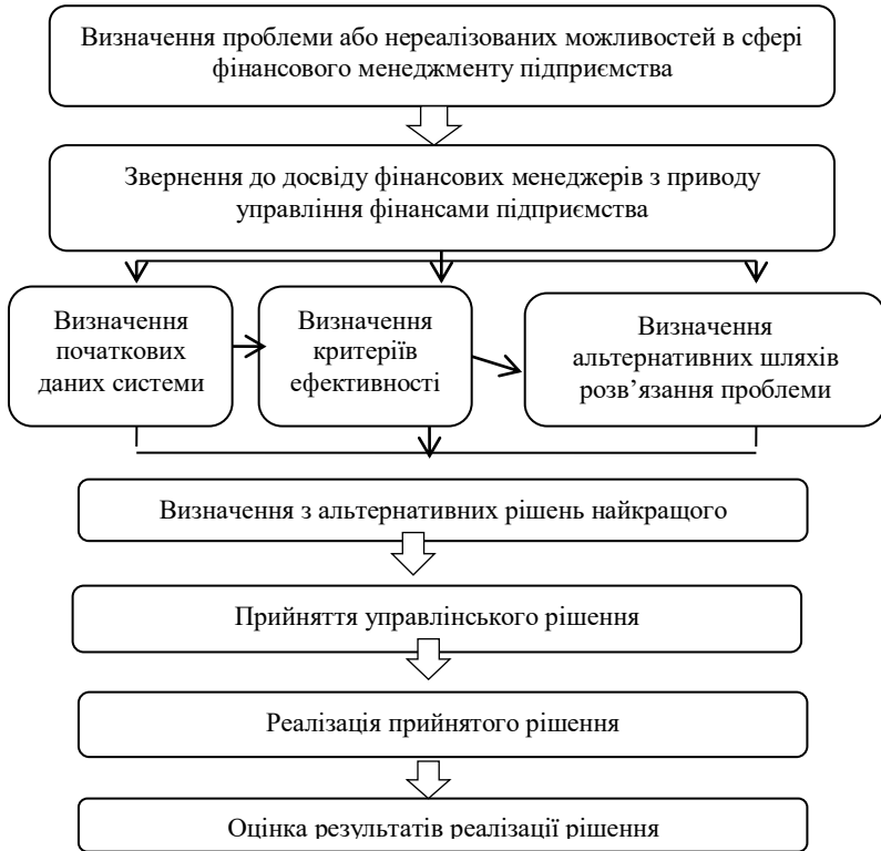
Рис. 3. Система фінансового менеджменту підприємства

Система фінансового менеджменту на підприємстві є циклічним процесом та потребує постійного вдосконалення. На другому етапі управління фінансові менеджери аналізують можливість виникнення подібних проблем чи ситуацій у минулому та пристосовують набутий