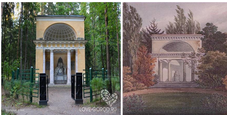
Рис. 2. «Пам'ятник родителям» Рис.3. Павільйон «Ротонда», 1828 р. Павловський парк

Білої Церкви, відмовитися від будівництва грандіозного мавзолею і у гущавині «Дружнього саду» побудувати лише павільйон «Ротонда» на вшанування пам'яті Г. Потьомкіна [1, с.10]. Слід зазначити, що ця архітектурна споруда мала багат спільного з павільйоном «Пам'ятник батькам» у Павловському парку Санкт–Петербурга [4] (архітектор Ч. Камерон) (рис.2, 3).