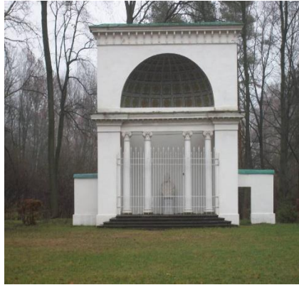
Рис. 4. 1946 р. Рис. 5. 2016 р.

Сучасна висота споруди 10, 5 м, ширина 9 м. У композиційному плані – це частина потовщеної стіни, виготовлена у формі мушлі з внутрішнім отвором у вигляді арочного порталу, який пересікає масивний архітрав, збудований на 4 колонах з капітелями коринфського ордеру. Купол та арка будівлі також декоративн оформлені. Підлога та східці виконан з граніту [3, с. 58]