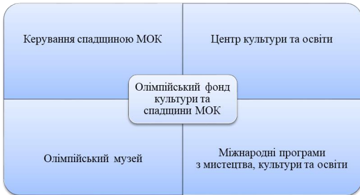
Рис. 1. Складові функціонування Олімпійського фонду культури та спадщини Міжнародного олімпійського комітету

Аналіз змісту діяльності Олімпійського фонду культури та спадщини дозволяє виділити чотири основні напрями його роботи (рис. 1).