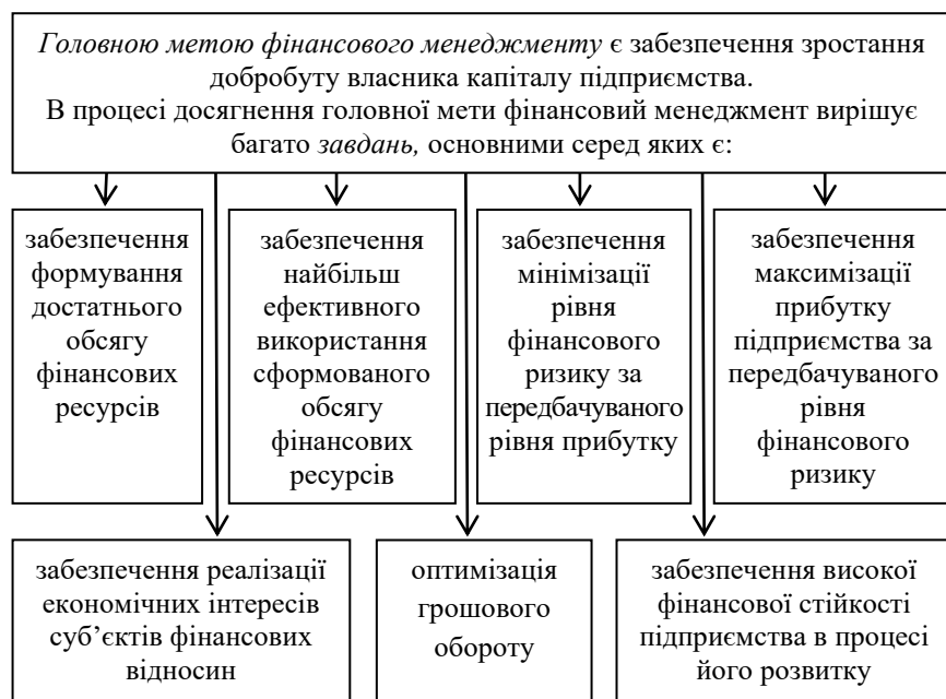
Рис. 1. Мета та завдання фінансового менеджменту

менеджменту передбачає орієнтацію на управління грошовими потоками підприємства в розрізі операційної, інвестиційної та фінансової діяльності і базується на концепції фінансової рівноваги підприємства.