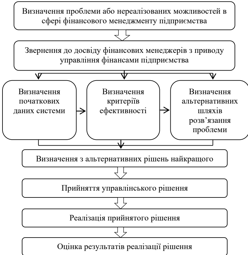
Рис. 3. Система фінансового менеджменту підприємства

На наш погляд, систему фінансового менеджменту підприємства можна представити у вигляді схеми (рис. 3). Визначення проблеми або нереалізованих можливостей виявляється фінансовими менеджерами при оцінці реалізації попередніх рішень або при аналізі фінансово-господарської діяльності підприємства [3, с. 18].