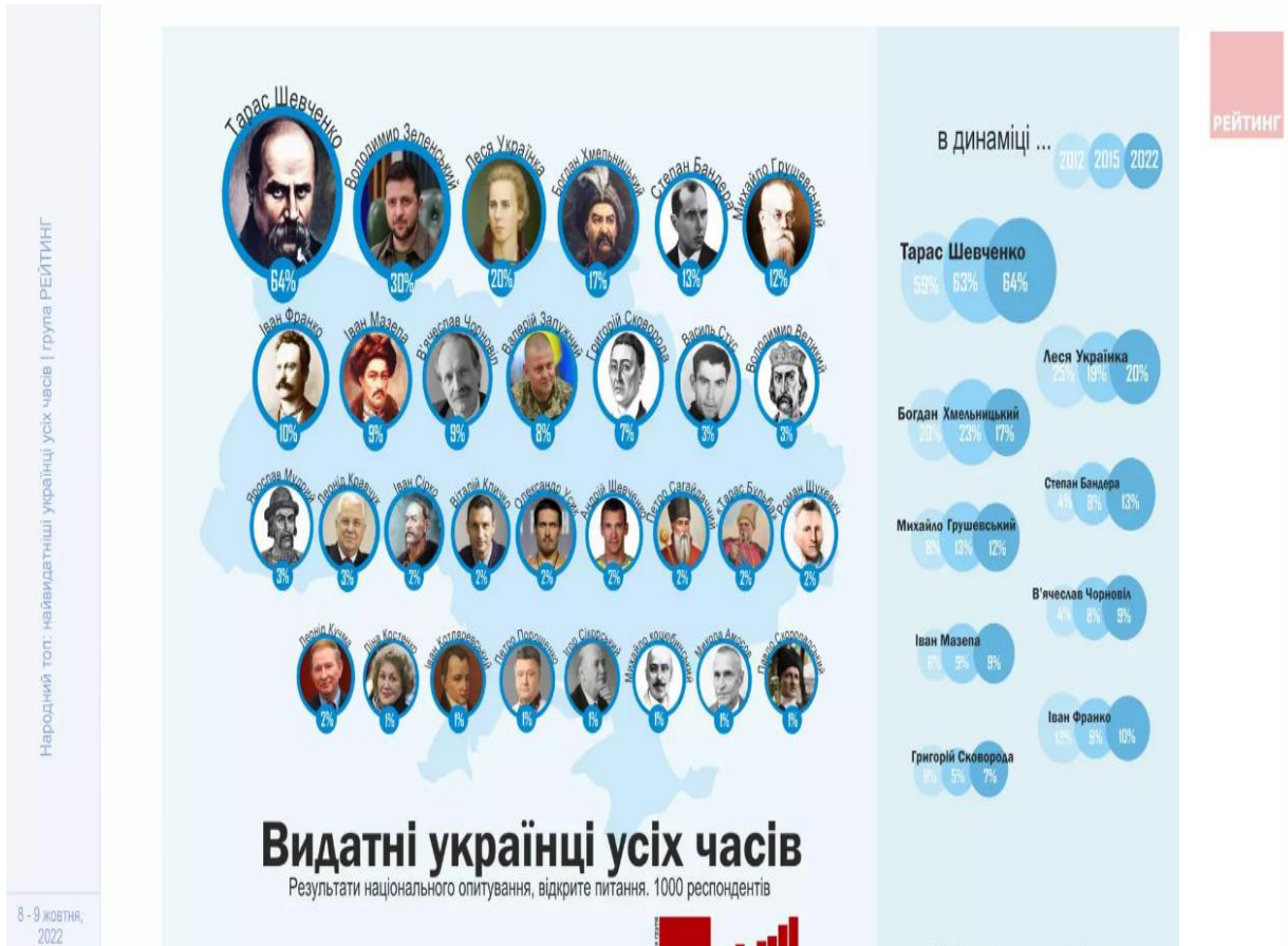
Мал. 3.1. Видатні українці у дослідженні проекту “Народний ТОП”