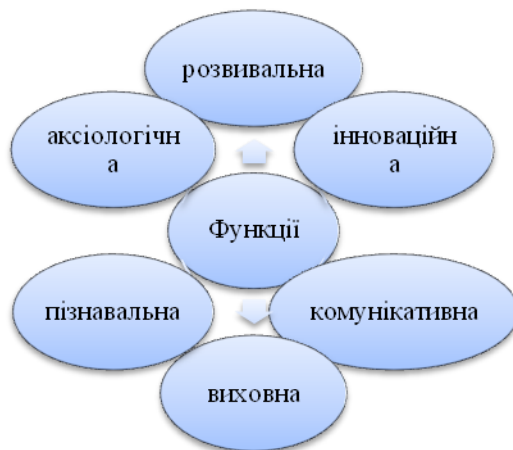
Рис. 1.2. Функції процесу підготовки бакалаврів з туризму до професійної взаємодії зі споживачами туристичних послуг

– оволодіння студентами комунікативними стратегіями для успішної професійної взаємодії зі споживачами туристичних послуг.