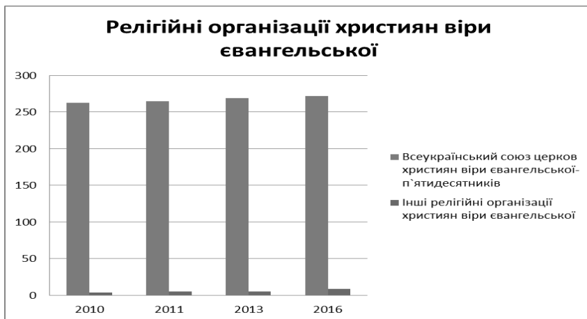
Рис. 3. Релігійні організації християн віри євангельської п'ятидесятників в Рівненській області [4; 5]