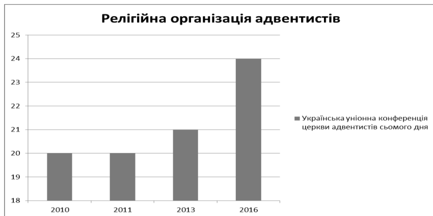
Рис. 4. Релігійна організація адвентистів на Рівненщині [4; 5]

Варто зауважити, що в територіальному аспекті Українська Греко-католицька церква представлена лише двома громадами в містах Рівне та Сарни. Проте громади Римо-Католицької церкви (їх понад 20 [4]) поширилися в усіх містах обласного підпорядкування та низці поселень Рівненщини.