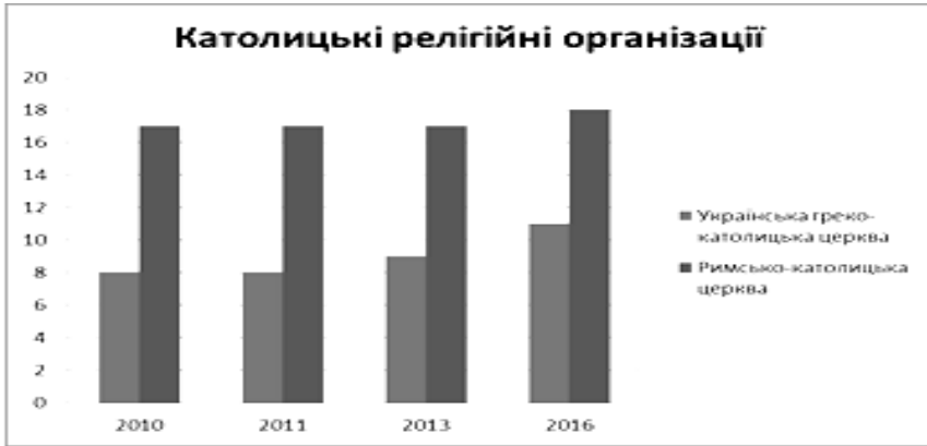
Рис. 5. Католицькі релігійні організації в Рівненській області [4; 5]

За результатами дослідження особливостей розвитку релігійної ситуації у Рівненській області, варто зазначити, що найбільш масовим серед різноманітних конфесій залишається православ'я. На другому місці протестантизм, що проявляється як специфічна особливість Рівненщини, відмінна від релігійної ситуації сусідніх областей. Характерною рисою релігійної сфери регіону є зростання чисельності релігійних організацій. Найбільш впливовими є позиції релігійних громад міста Рівного. Строкатість релігійної ситуації на Рівненщині на сучасному етапі, на нашу думку, пояснюється відродження релігійного життя на поліконфесійній основі. Тому аналіз релігійної ситуації, що виступає як основа розвитку релігійної сфери в рамках соціального життя суспільства вимагає поєднання ретроспективного відтворення формування релігійної ситуації на різних етапах історичного розвитку регіону.